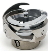
Hook Completed assembly - 0251 GN197 Greifer Gesamte Baugruppe - 0251 GN197