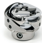
Hook residual thread (Multi Bob hook) Completed assembly - 0271 001991 Greifer Restfadenwächter (Multi Bob Greifer) Gesamte Baugruppe - 0271 001991