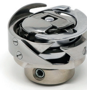
Hook oil-free Completed assembly - 0271 150034 Greifer Ölfrei Gesamte Baugruppe - 0271 150034