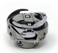
Hook 26 mm Ø Completed assembly - 0367 156034 Greifer 26 mm Ø Gesamte Baugruppe - 0367 156034