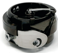
Hook XXL 32 mm Ø DLC-coated Completed assembly - 0868 150484 Greifer XXL 32 mm Ø DLC-Beschichtet Gesamte Baugruppe - 0868 150484