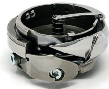
Hook XXXL 40 mm Ø Completed assembly - 0867 152094 Greifer XXXL 40 mm Ø Gesamte Baugruppe - 0867 152094