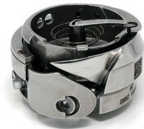
Hook 32 mm Ø Completed assembly - 0667 155634 Greifer 32 mm Ø Gesamte Baugruppe - 0667 155634