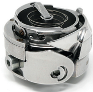
Hook 26 mm Ø Completed assembly - 0667 155604 Greifer 26 mm Ø Gesamte Baugruppe - 0667 155604