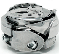
Hook CLB300 (BOBBINE) 32 mm Ø Completed assembly - 0667 156224 Greifer CLB300 (BOBBINE) 32 mm Ø Gesamte Baugruppe - 0667 156224