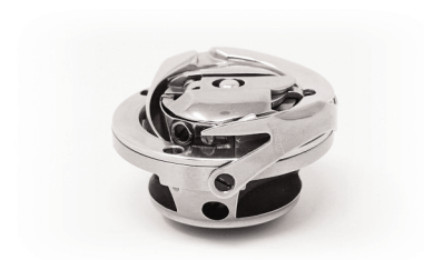
Hook Completed assembly - 0265 000771 Greifer Gesamte Baugruppe - 0265 000771