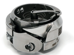
Hook Completed assembly - 24142-39453 Greifer Gesamte Baugruppe - 24142-39453