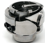
Hook Completed assembly - 0767 150294 Greifer Gesamte Baugruppe - 0767 150294