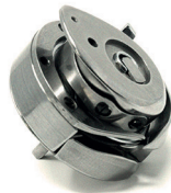
Hook Completed assembly - 0380 008104 Greifer Gesamte Baugruppe - 0380 008104