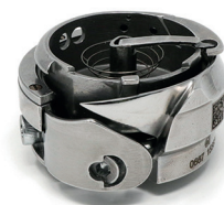
Hook 32 mm Ø Completed assembly - 0667 155634 Greifer 32 mm Ø Gesamte Baugruppe - 0667 155634