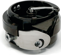
Hook XXL 32 mm Ø DLC-coated Completed assembly - 0868 150484 Greifer XXL 32 mm Ø DLC-Beschichtet Gesamte Baugruppe - 0868 150484