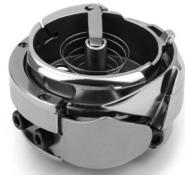
Hook 32 mm Ø Completed assembly - 91-501 015-91 Greifer 32 mm Ø Gesamte Baugruppe - 91-501 015-91