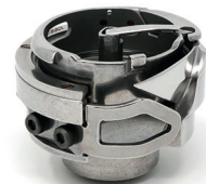
Hook Completed assembly - 0767 150574 Greifer Gesamte Baugruppe - 0767 150574