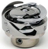
Hook oil-free Completed assembly - 0271 150034 Greifer Ölfrei Gesamte Baugruppe - 0271 150034