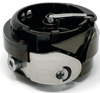
Hook XXL 32 mm Ø DLC-coated Completed assembly - 0868 150484 Greifer XXL 32 mm Ø DLC-Beschichtet Gesamte Baugruppe - 0868 150484