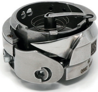
Hook 32 mm Ø Completed assembly - 0667 155634 Greifer 32 mm Ø Gesamte Baugruppe - 0667 155634