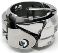
Hook Completed assembly - 0867 150754 Greifer Gesamte Baugruppe - 0867 150754