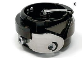
Hook 32 mm Ø Short thread trimmer DLC-coated (*Image may differ from product) Completed assembly - 0867 154674 Greifer 32 mm Ø Kurzfadenabschneider DLC-Beschichtet (*Bild kann vom Produkt abweichen) Gesamte Baugruppe - 0867 154674