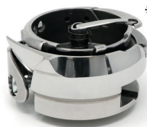
Hook 32 mm Ø Short thread trimmer & Skip stitch detection (*Image may differ from product) Completed assembly - 0867 151294 Greifer 32 mm Ø Kurzfadensabschneider & Fehlstickerkennung (*Bild kann vom Produkt abweichen) Gesamte Baugruppe - 0867 151294