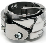
Hook 32 mm Ø Short thread trimmer Completed assembly - 0867 150754 Greifer 32 mm Ø Kurzfasenabschneider Gesamte Baugruppe - 0867 150754