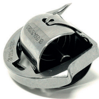
Shuttle (only for rotating hooks)