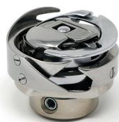
Hook oil-free Completed assembly - 0271 150034 Greifer Ölfrei Gesamte Baugruppe - 0271 150034