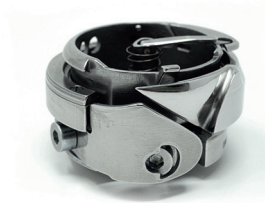
Hook 32 mm Ø Completed assembly - 0867 154264 Greifer 32 mm Ø Gesamte Baugruppe - 0867 154264