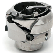
Hook Completed assembly - 0467 150094 Greifer Gesamte Baugruppe - 0467 150094