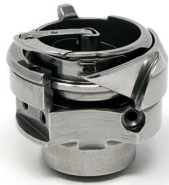
Hook Completed assembly - 0467 150854 Greifer Gesamte Baugruppe - 0467 150854