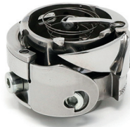
Hook 26 mm Ø One- & Two needle Completed assembly - 0888 150754 Greifer 26 mm Ø Ein- & Zweinadel Gesamte Baugruppe - 0888 150754