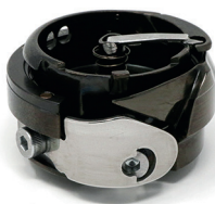
Hook 26 mm Ø DLC-coated Completed assembly - 0868 150434 Greifer Gross 26 mm Ø DLC-Beschichtet Gesamte Baugruppe - 0868 150434