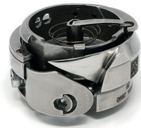
Hook 32 mm Ø Completed assembly - 0667 155634 Greifer 32 mm Ø Gesamte Baugruppe - 0667 155634