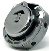
Hook left/right two needle Hook one needle Completed assembly - 0269 151814 Greifer links/rechts Zweinadel Greifer Einnadel Gesamte Baugruppe - 0269 151814