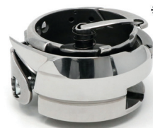
Hook 32 mm Ø Short thread trimmer & Skip stitch detection (*Image may differ from product) Completed assembly - 0867 151294 Greifer 32 mm Ø Kurzfadenabschneider & Fehlstickererkennung (*Bild kann vom Produkt abweichen) Gesamte Baugruppe - 0867 151294