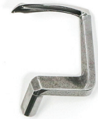
2-needle sewing unit for general sewing work in medium-heavy material Complete assembly - 0195 005055 2-Nadel-Nähinrichtung für allgemeine Näharbeiten in mittelschwerem Nähgut Gesamte Baugruppe - 0195 005055