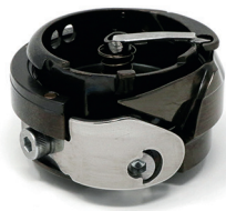
Hook 28 mm Ø DLC-coated Completed assembly - 0867 154544 Greifer 28 mm Ø DLC-Beschichtet Gesamte Baugruppe - 0867 154544