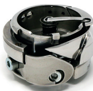
Hook XXL Completed assembly - 0867 150514 Greifer XXL Gesamte Baugruppe - 0867 150514