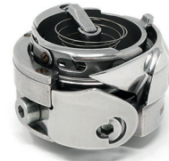
Hook 26 mm Ø Completed assembly - 0667 155604 Greifer 26 mm Ø Gesamte Baugruppe - 0667 155604