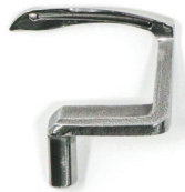
Looper Completed assembly - 0933 000337 Greifer Gesamte Baugruppe - 0933 000337