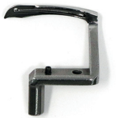
Looper Completed assembly - 0195 004753 Greifer Gesamte Baugruppe - 0195 004753