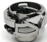
Hook with residual thread detector Completed assembly - 0767 150334 Greifer mit Restfadenwächter Gesamte Baugruppe - 0767 150334