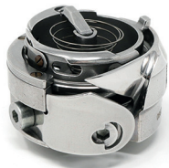
Hook 26 mm Ø Completed assembly - 0667 155604 Greifer 26 mm Ø Gesamte Baugruppe - 0667 155604