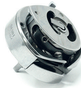
Hook (oilfree) Completed assembly - 0381 150204 Greifer (Ölfrei) Gesamte Baugruppe - 0381 150204