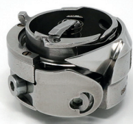
Hook 26 mm Ø Completed assembly - 0867 150804 Greifer 26 mm Ø Gesamte Baugruppe - 0867 150804