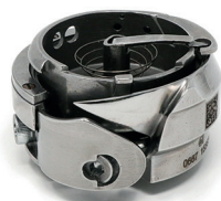
Hook 32 mm Ø Completed assembly - 0667 155634 Greifer 32 mm Ø Gesamte Baugruppe - 0667 155634