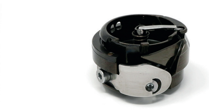
Hook 26 mm Ø DLC-coated Completed assembly - 0868 150434 Greifer 26 mm Ø DLC-Beschichtet Gesamte Baugruppe - 0868 150434