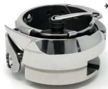
Hook (*Image may differ from product) Completed assembly - 0396 150814 Greifer (*Bild kann vom Produkt abweichen) Gesamte Baugruppe - 0396 150814