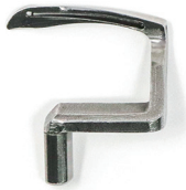
Looper Completed assembly - 0933 000341 Greifer Gesamte Baugruppe - 0933 000341