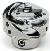
Hook residual thread Completed assembly - 0271 001991 Greifer Restfaden Gesamte Baugruppe - 0271 001991