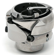
Hook thread trimmer incl. cover ring without bobbin