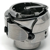
Hook with residual thread detector Completed assembly - 0767 150504 Greifer mit Restfadenwächter Gesamte Baugruppe - 0767 150504