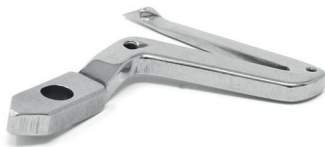
Lower looper Completed assembly - B3301755.00 Untergreifer Gesamte Baugruppe - B3301755.00