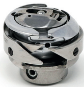
Hook 170% residual thread radial with bobbin case & bobbin case holder