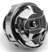
Hook Completed assembly - 91-265 262-91 Greifer Gesamte Baugruppe - 91-265 262-91