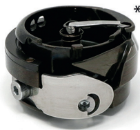
Hook 32 mm Ø DLC-coated (*Image may differ from product) Completed assembly - 0867 154504 Greifer 32 mm Ø DLC-Beschichtet (*Bild kann vom Produkt abweichen) Gesamte Baugruppe - 0867 154504