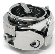
Hook 26 mm Ø Completed assembly - 0667 155604 Greifer 26 mm Ø Gesamte Baugruppe - 0667 155604