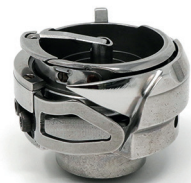
Hook Completed assembly - 0767 150324 Greifer Gesamte Baugruppe - 0767 150324