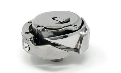
Hook Completed assembly - 0267 151884 Greifer Gesamte Baugruppe - 0267 151884