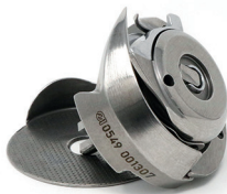
Hook Completed assembly - 0549 001491 Greifer Gesamte Baugruppe - 0549 001491