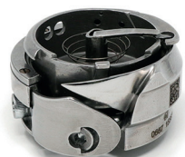
Hook 32 mm Ø with residual thread detector Completed assembly - 0667 155634 Greifer 32 mm Ø mit Restfadenwächter Gesamte Baugruppe - 0667 155634