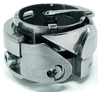
Hook 28 mm Ø Completed assembly - 0867 154194 Greifer 28 mm Ø Gesamte Baugruppe - 0867 154194