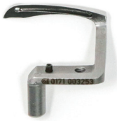
Looper Completed assembly - 0171 003253 Greifer Gesamte Baugruppe - 0171 003253