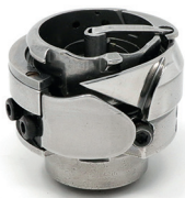
Hook for one needle / two needle with thread trimmer