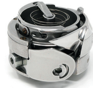
Hook 26 mm Ø Completed assembly - 0667 155604 Greifer 26 mm Ø Gesamte Baugruppe - 0667 155604