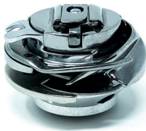
Hook Completed assembly - 0556 005003 Greifer Gesamte Baugruppe - 0556 005003