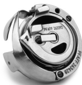
Hook Completed assembly - 91-263 430-91 Greifer Gesamte Baugruppe - 91-263 430-91