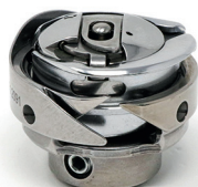
Hook 170 % Completed assembly - 0271 002091 Greifer 170 % Gesamte Baugruppe - 0271 002091