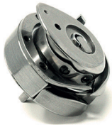
Hook Completed assembly - 0380 008104 Greifer Gesamte Baugruppe - 0380 008104