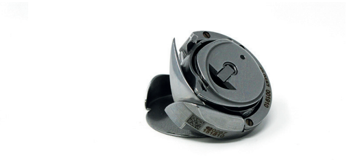
Hook with thread trimmer without bobbin (Bobbin case & Bobbin case holder) Completed assembly - 0268 151854 Greifer mit Fadenabschneider ohne Spule (Spulengehäuseober- & -unterteil) Gesamte Baugruppe - 0268 151854