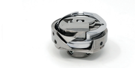
Hook 32 mm Ø Completed assembly - 0667 152014 Greifer 32 mm Ø Gesamte Baugruppe - 0667 152014