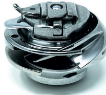
Hook Completed assembly - 0556 005006 Greifer Gesamte Baugruppe - 0556 005006