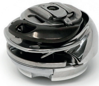
Hook XL Completed assembly - 0540 150204 Greifer XL Gesamte Baugruppe - 0540 150204