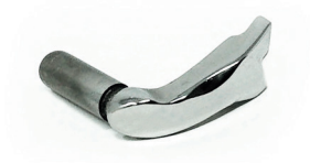
Hook left Completed assembly - 0578 003011 Greifer links Gesamte Baugruppe - 0578 003011