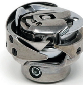
Hook Completed assembly - 0265 012786 Greifer Gesamte Baugruppe - 0265 012786