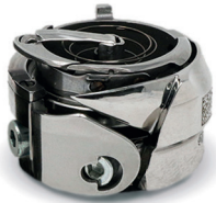
Hook 26 mm Ø whitout opener Completed assembly - 0869 150354 Greifer 26 mm Ø ohne Lüfter Gesamte Baugruppe - 0869 150354