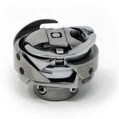
Hook 26 mm Ø Completed assembly - 0367 156034 Greifer 26 mm Ø Gesamte Baugruppe - 0367 156034