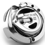
Hook Completed assembly - 91-263 435-91 Greifer Gesamte Baugruppe - 91-263 435-91