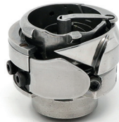
Hook Completed assembly - 0467 150014 Greifer Gesamte Baugruppe - 0467 150014