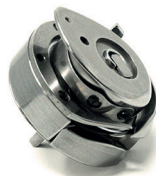
Hook Completed assembly - 0380 008104 Greifer Gesamte Baugruppe - 0380 008104