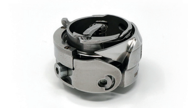
Hook 26 mm Ø Completed assembly - 0867 150804 Greifer 26 mm Ø Gesamte Baugruppe - 0867 150804