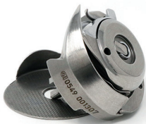
Hook cpl. with hook & bobbin case Completed assembly - 0549 001491 Greifer kpl. inkl. Greifer & Spulengehäuse Gesamte Baugruppe - 0549 001491