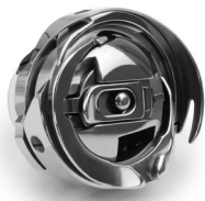
Hook Completed assembly - 91-265 280-91 Greifer Gesamte Baugruppe - 91-265 280-91