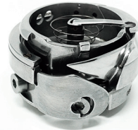
Hook 32 mm Ø Short thread trimmer Completed assembly - 0667 156044 Greifer 32 mm Ø Kurzfasenabschneider Gesamte Baugruppe - 0667 156044