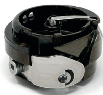
Hook 26 mm Ø DLC-coated Completed assembly - 0868 150434 Greifer Gross 26 mm Ø DLC-Beschichtet Gesamte Baugruppe - 0868 150434