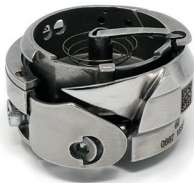
Hook 32 mm Ø Completed assembly - 0667 155634 Greifer 2 mm Ø Gesamte Baugruppe - 0667 155634