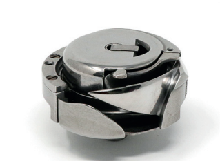
Hook Completed assembly - 0267 151814 Greifer Gesamte Baugruppe - 0267 151814