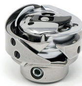
Hook residual thread radial with bobbin case & bobbin case holder