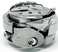
Hook CLB300 (BOBBINE) 32 mm Ø Completed assembly - 0667 156224 Greifer CLB300 (BOBBINE) 32 mm Ø Gesamte Baugruppe - 0667 156224