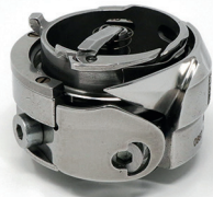
Hook 26 mm Ø Completed assembly - 0867 150804 Greifer 26 mm Ø Gesamte Baugruppe - 0867 150804