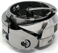
Hook 32 mm Ø Completed assembly - 0667 155634 Greifer 32 mm Ø Gesamte Baugruppe - 0667 155634