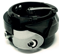
Hook 32 mm Ø Short thread trimmer DLC-coated Completed assembly - 0867 150864 Greifer 32 mm Ø Kurzfasenabschneider DLC-Beschichtet Gesamte Baugruppe - 0867 150864