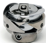
Hook 170 % Completed assembly - 0271 002091 Greifer 170 % Gesamte Baugruppe - 0271 002091