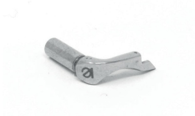
Hook right Completed assembly - 0557 000602 A Greifer rechts Gesamte Baugruppe - 0557 000602 A