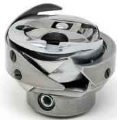
Hook straight flap Completed assembly - 0271 150124 Greifer Gerade Klappe Gesamte Baugruppe - 0271 150124