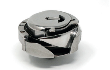
Hook Completed assembly - 0267 151814 Greifer Gesamte Baugruppe - 0267 151814