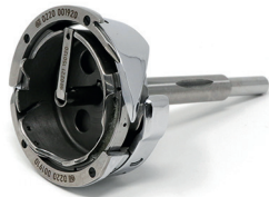
Hook left/right with thread trimmer