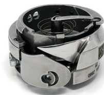
Hook 32 mm Ø Completed assembly - 0667 155634 Greifer 32 mm Ø Gesamte Baugruppe - 0667 155634