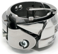
Hook 32 mm Ø Short thread trimmer Completed assembly - 0867 150754 Greifer 32 mm Ø Kurzfasenabschneider Gesamte Baugruppe - 0867 150754