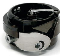
Hook XXL 32 mm Ø DLC-coated Completed assembly - 0868 150484 Greifer XXL 32 mm Ø DLC-Beschichtet Gesamte Baugruppe - 0868 150484