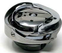
Hook R 253 Completed assembly - S980 008253 Greifer R 253 Gesamte Baugruppe - S980 008253