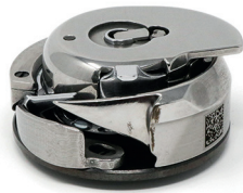
Hook in three parts Completed assembly - 0491 012041 Greifer Dreiteilig Gesamte Baugruppe - 0491 012041