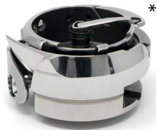
Hook (*Image may differ from product)