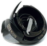
Hook DLC-coated Completed assembly - 0768 151814 Greifer DLC-Beschichtet Gesamte Baugruppe - 0768 151814