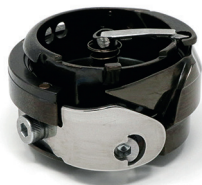
Hook 26 mm Ø DLC-coated Completed assembly - 0868 150434 Greifer Gross 26 mm Ø DLC-Beschichtet Gesamte Baugruppe - 0868 150434