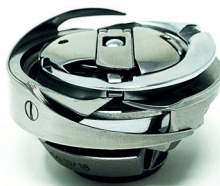
Hook R 250 Completed assembly - S980 008250 Greifer für R 250 Gesamte Baugruppe - S980 008250