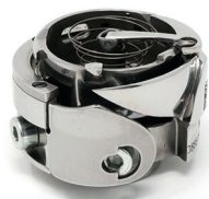
Hook 26 mm Ø Completed assembly - 0888 150754 Greifer 26 mm Ø Gesamte Baugruppe - 0888 150754