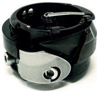
Hook 32 mm Ø Short thread trimmer DLC-coated Completed assembly - 0867 150864 Greifer 32 mm Ø Kurzfasenabschneider DLC-beschichtet Gesamte Baugruppe - 0867 150864