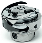
Hook C 235 Completed assembly - S522 000235 Greifer C 235 Gesamte Baugruppe - S522 000235