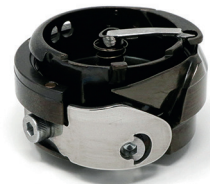
Hook 26 mm Ø DLC-coated Completed assembly - 0868 150434 Greifer Gross 26 mm Ø DLC-Beschichtet Gesamte Baugruppe - 0868 150434