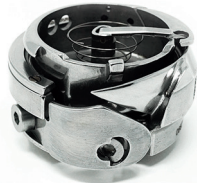
Hook Completed assembly - 0667 156044 Greifer Gesamte Baugruppe - 0667 156044