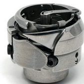
Hook Completed assembly - 0767 150504 Greifer Gesamte Baugruppe - 0767 150504