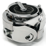
Hook 26 mm Ø Completed assembly - 0667 155604 Greifer 26 mm Ø Gesamte Baugruppe - 0667 155604