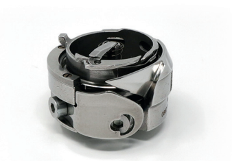
Hook Completed assembly - 24131-40817 Greifer Gesamte Baugruppe - 24131-40817