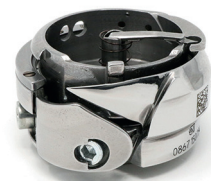
Hook 32 mm Ø Short thread trimmer Completed assembly - 0867 150754 Greifer 32 mm Ø Kurzfadenabschneider Gesamte Baugruppe - 0867 150754