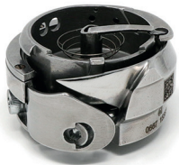
Hook 32 mm Ø Completed assembly - 0667 155634 Greifer 32 mm Ø Gesamte Baugruppe - 0667 155634