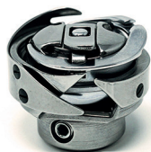
Hook Completed assembly - 0272 001121 Greifer Gesamte Baugruppe- 0272 001121