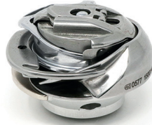
Hook Complete assembly - 0577 150014 Greifer Gesamte Baugruppe - 0577 150014