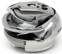
Hook Completed assembly - 0540 150104 Greifer Gesamte Baugruppe - 0540 150104