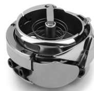
Hook 26 mm Ø Completed assembly - 91-501 017-91 Greifer 26 mm Ø Gesamte Baugruppe - 91-501 017-91