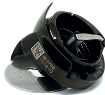
Hook thread trimmer DLC-coated Completed assembly - 0768 151834 Greifer Fadenabschneider DLC-Beschichtet Gesamte Baugruppe - 0768 151834