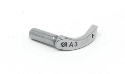
Hook left Completed assembly - 0557 002872 + 0557 002872 A Greifer links Gesamte Baugruppe - 0557 002872 + 0557 002872 A