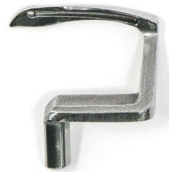
Looper Completed assembly - 0933 000337 Greifer Gesamte Baugruppe - 0933 000337