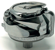
Hook Completed assembly - S981 008816 Greifer Gesamte Baugruppe - S981 008816