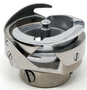
Hook Completed assembly - 0251 GN1033 Greifer Gesamte Baugruppe - 0251 GN1033