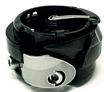
Hook 32 mm Ø Short thread trimmer DLC-coated Completed assembly - 0867 150864 Greifer 32 mm Ø Kurzfadenabschneider DLC-Beschichtet Gesamte Baugruppe - 0867 150864