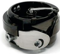
Hook XXL 32 mm Ø DLC-coated Completed assembly - 0868 150484 Greifer XXL 32 mm Ø DLC-beschichtet Gesamte Baugruppe - 0868 150484