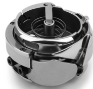
Hook 26 mm Ø Completed assembly - 91-501 017-91 Greifer 26 mm Ø Gesamte Baugruppe - 91-501 017-91