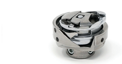
Hook Completed assembly - 0367 155214 Greifer Gesamte Baugruppe - 0367 155214