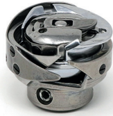
Hook Completed assembly - 0265 012321 Greifer Gesamte Baugruppe - 0265 012321