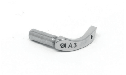
Hook left Completed assembly - 0557 002872 A Greifer links Gesamte Baugruppe - 0557 002872 A