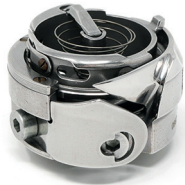
Hook 26 mm Ø Completed assembly - 0667 155604 Greifer 26 mm Ø Gesamte Baugruppe - 0667 155604