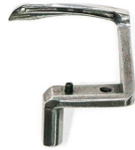
Sewing unit for threads from 25/3 (Airbag) Complete assembly - 0195 004753 A Nähinrichtung für Airbag-Näharbeiten mit Fäden ab 25/3 Gesamte Baugruppe - 0195 004753 A