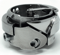
Hook 32 mm Ø Short thread trimmer Completed assembly - 0867 154414 Greifer 32 mm Ø Kurzfadenabschneider Gesamte Baugruppe - 0867 154414