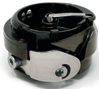
Hook XXL 32 mm Ø DLC-coated Completed assembly - 0868 150484 Greifer XXL 32 mm Ø DLC-Beschichtet Gesamte Baugruppe - 0868 150484