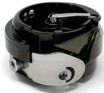
Hook 26 mm Ø DLC-coated Completed assembly - 0868 150434 Greifer Gross 26 mm Ø DLC-Beschichtet Gesamte Baugruppe - 0868 150434