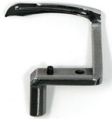
Looper Complete assembly - 0195 004753 Greifer Gesamte Baugruppe - 0195 004753