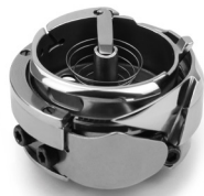
Hook 32 mm Ø Completed assembly - 91-501 015-91 Greifer 32 mm Ø Gesamte Baugruppe - 91-501 015-91