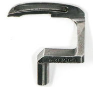
Looper Completed assembly - 0931 002058 Greifer Gesamte Baugruppe - 0931 002058