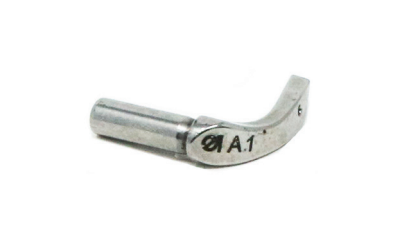
Hook left Completed assembly - 0557 002872 Greifer links Gesamte Baugruppe - 0557 002872