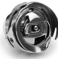
Hook Completed assembly - 91-265 280-91 Greifer Gesamte Baugruppe - 91-265 280-91