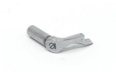
Hook right Completed assembly - 0557 000602 A Greifer rechts Gesamte Baugruppe - 0557 000602 A