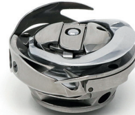
Hook Completed assembly - 0265 004029 Greifer Gesamte Baugruppe - 0265 004029