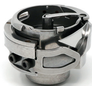
Hook with residual thread detector Completed assembly - 0767 150574 Greifer mit Restfadenwächter Gesamte Baugruppe - 0767 150574