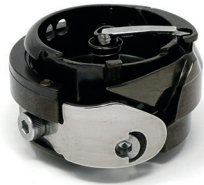
Hook 26 mm Ø DLC-coated Completed assembly - 0868 150434 Greifer Gross 26 mm Ø DLC-Beschichtet Gesamte Baugruppe - 0868 150434