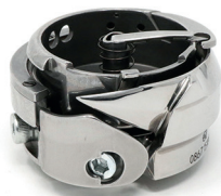
Hook 32 mm Ø Completed assembly - 0867 151004 Greifer 32 mm Ø Gesamte Baugruppe - 0867 151004