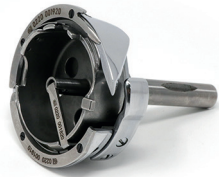
Hook with bobbin left/right without thread trimmer