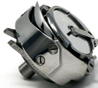
Hook R820 Complete assembly - S981 008820 Greifer R820 Gesamte Baugruppe - S981 008820