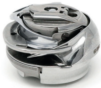
Hook Complete assembly - 0540 150104 Greifer Gesamte Baugruppe - 0540 150104