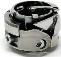
Hook 26 mm Ø Short thread trimmer Completed assembly - 0867 150914 Greifer 26 mm Ø Kurzfasenabschneider Gesamte Baugruppe - 0867 150914