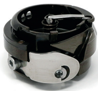
Hook 26 mm Ø DLC-coated Completed assembly - 0868 150434 Greifer Gross 26 mm Ø DLC-Beschichtet Gesamte Baugruppe - 0868 150434