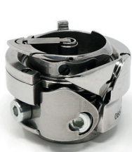
Hook 22 mm Ø Completed assembly - 0667 156404 Greifer 22 mm Ø Gesamte Baugruppe - 0667 156404