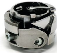
Hook 26 mm Ø Short thread trimmer Completed assembly - 0867 150914 Greifer 26 mm Ø Kurzfasenabschneider Gesamte Baugruppe - 0867 150914