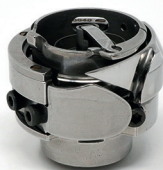
Hook with residual thread detector Completed assembly - 0767 150194 Greifer mit Restfadenwächter Gesamte Baugruppe - 0767 150194