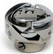
Hook Completed assembly - 0251 GN177 Greifer Gesamte Baugruppe - 0251 GN177