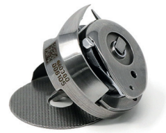
Hook Completed assembly - 0697 004331 Greifer Gesamte Baugruppe - 0697 004331