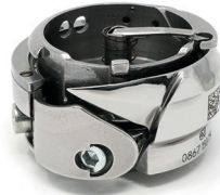
Hook Short thread trimmer Completed assembly - 0867 150754 Greifer Kurzfadenabschneider Gesamte Baugruppe - 0867 150754