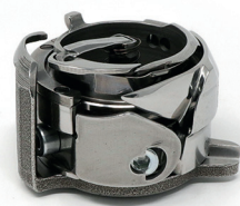
Hook 26 mm Ø Completed assembly - 0869 150364 Greifer 26 mm Ø Gesamte Baugruppe - 0869 150364