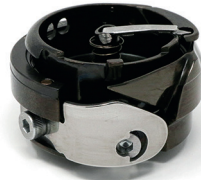
Hook 26 mm Ø DLC-coated Completed assembly - 0868 150434 Greifer Gross 26 mm Ø DLC-Beschichtet Gesamte Baugruppe - 0868 150434