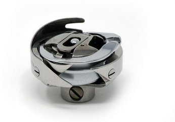
Hook thread trimmer