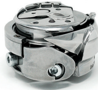
Hook CLB300 (BOBBINE) 32 mm Ø Completed assembly - 0667 156224 Greifer CLB300 (BOBBINE) 32 mm Ø Gesamte Baugruppe - 0667 156224