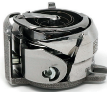
Hook 26 mm Ø Completed assembly - 0869 150214 Greifer 26 mm Ø Gesamte Baugruppe - 0869 150214