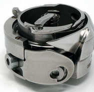
Hook 26 mm Ø Completed assembly - 0867 150804 Greifer 26 mm Ø Gesamte Baugruppe - 0867 150804