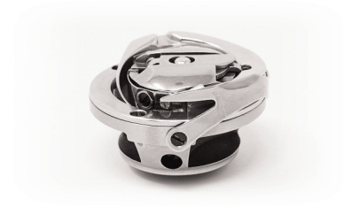
Hook Completed assembly - 0265 000771 Greifer Gesamte Baugruppe - 0265 000771