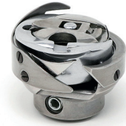
Hook straight flap Completed assembly - 0271 150124 Greifer Gerade Klappe Gesamte Baugruppe - 0271 150124