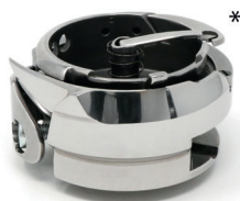
Hook (*Image may differ from product) Completed assembly - 24900-40961 Greifer (*Bild kann vom Produkt abweichen) Gesamte Baugruppe - 24900-40961