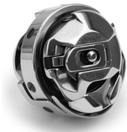
Hook Completed assembly - 91-265 262-91 Greifer Gesamte Baugruppe - 91-265 262-91