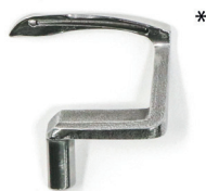
Hook (*Image may differ from product)